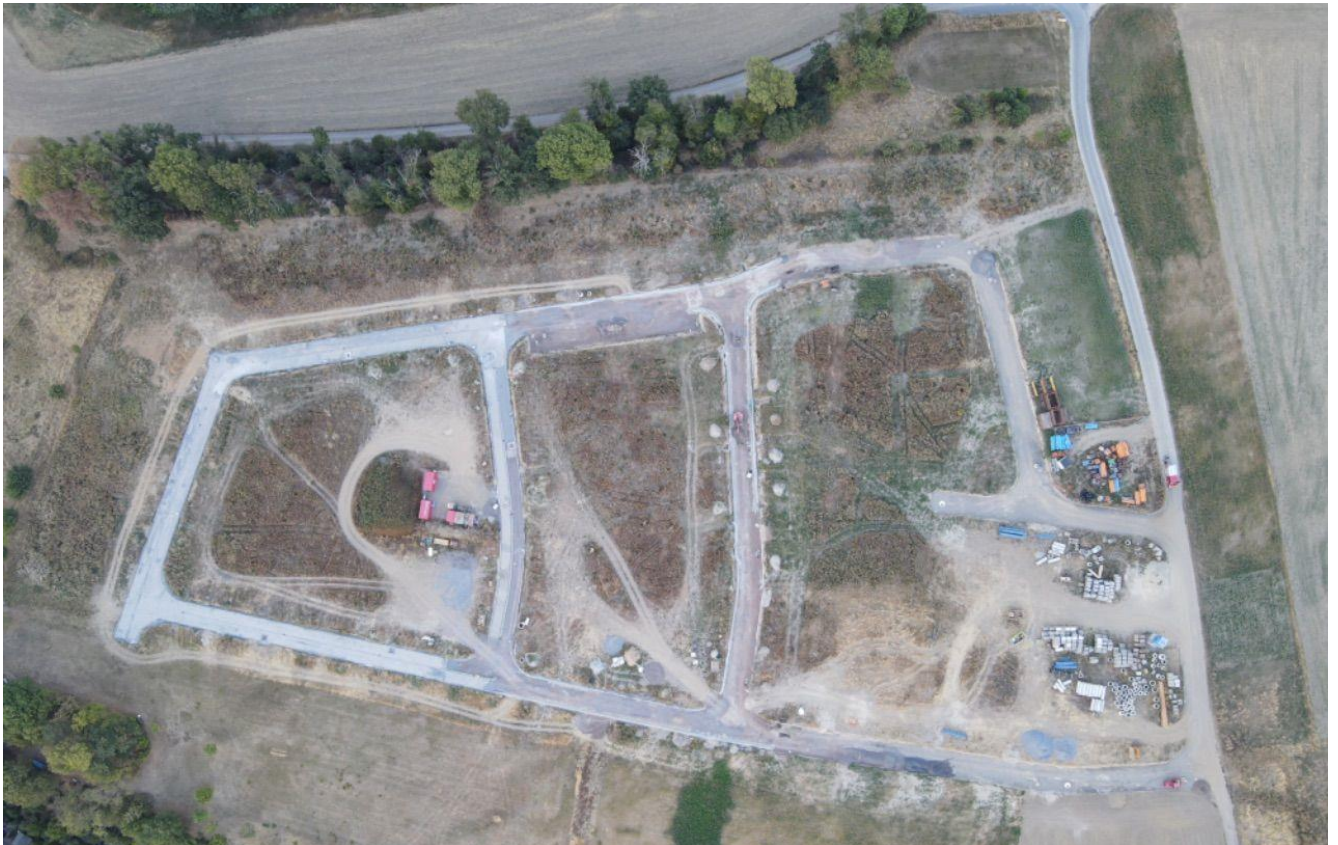
Luftaufnahme vom 11.09.2022